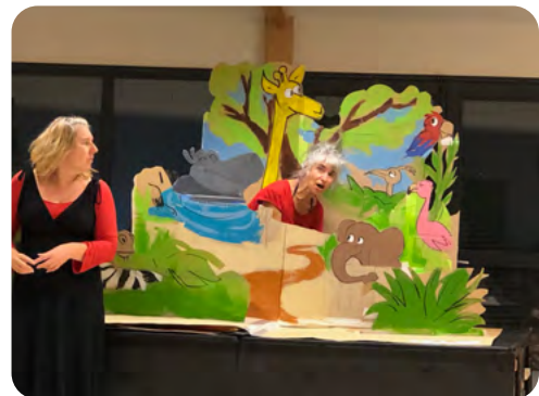
Ces photos représentent le prototype actuel du pop-up.

«Planète Mars, neuf heures du soir. Cher papa, chère maman.