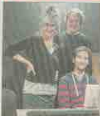
Revenù les Dieselles en piste pour préparer un nouveau spectacle tout public : Histoires pressées .