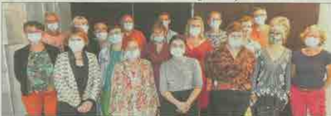
Toute l'équipe est sur le pont pour booster le redémarrage.

Seules les dates de la création éphémère Qui porte la colombe ? Et deux visites décalées de l'exposition Le Marbre et le Sang à H2M ont pu être, normalement, honorées. La Disco pétanque, l'évènement culturel et artistique de l'année est devenu une Disco pétanque confinée en vidéo avec toute