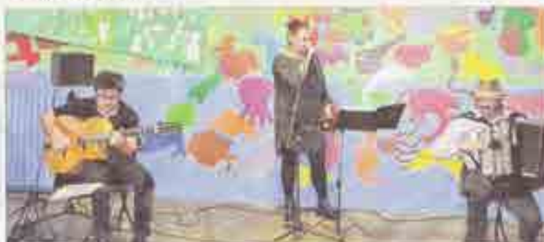
Avec son répertoire de Chansons françaises, de standards jazz et musiques du monde, Latcha Trio a fait voyager le public.