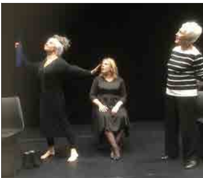
Les comédiennes ont joué leur spectacle Vieille moi jamais sur les planches de la Maison de la culture et de la citoyenneté.

Si le public est enchanté de la reprise des spectacles, l'enthousiasme des artistes est plus nuancé. « Ça nous fait un peu d'émotion de reprendre, après ce long temps de