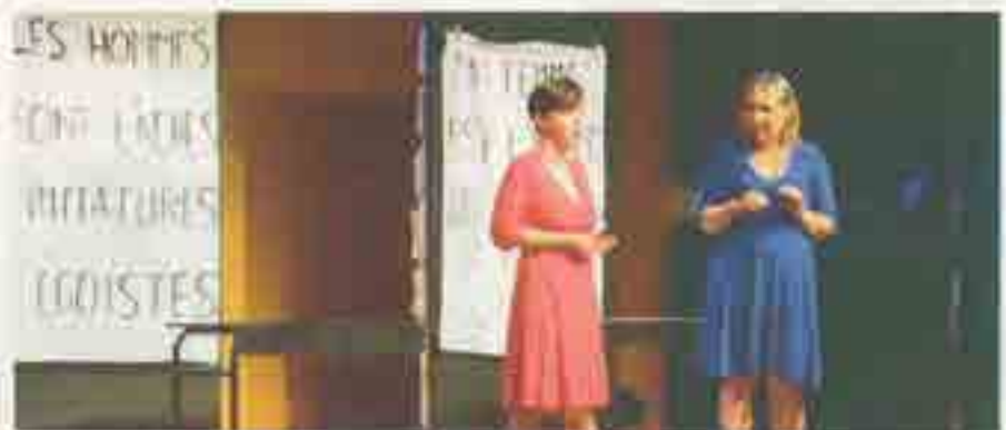
La Dieselle compagnie.

Entrée libre et gratuite. Respect du protocole sanitaire en vigueur. Pass sanitaire exigé à l'entrée (à partir de 12 ans).