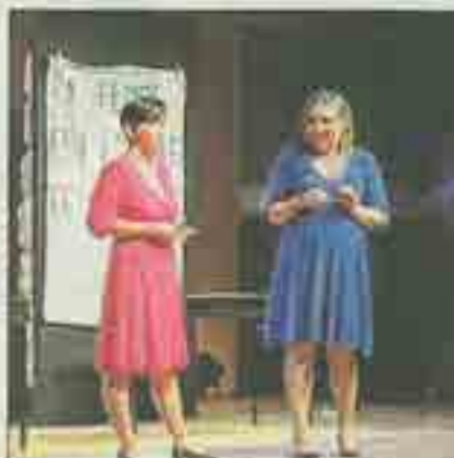
La compagnie « les dieselles compagnie » pendant leur pièce de théâtre.