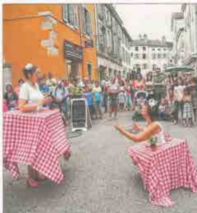
Tous dehors a lieu cette année du 30 juillet au 1 er août.