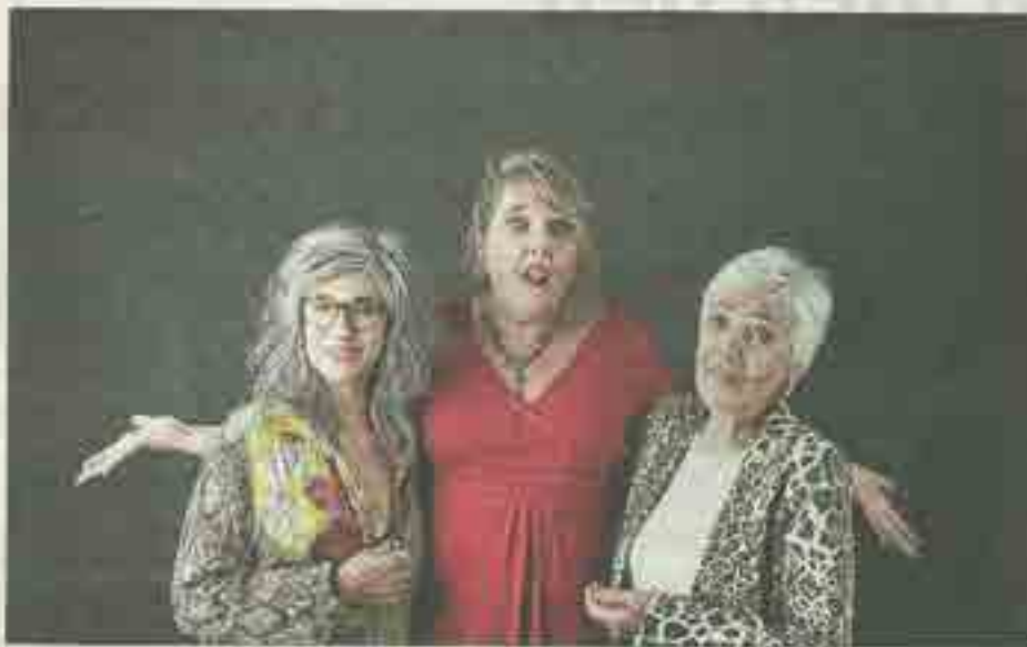
Les comédiennes abordent la vieillesse avec humour et dérision.

Viellir en étant une femme aujourd'hui, c'est tout l'enjeu du nouveau spectacle de la Dieselle Cie intitulé Vieille moi jamais . La représentation est prévue ce mercredi 19 mai à la Maison de la culture et de la citoyenneté.