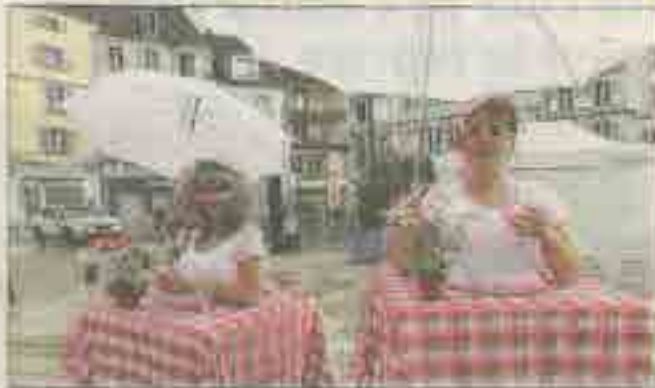
Les personnages de Belle Robe n'ont pas froid aux yeux, et tentent le tout pour le tout pour trouver l'amour.

Belle Robe a mis l'eau à la bouche du public et la langue dans tous les sens. Les vins, fromages, desserts et histoires d'amour ont composé le