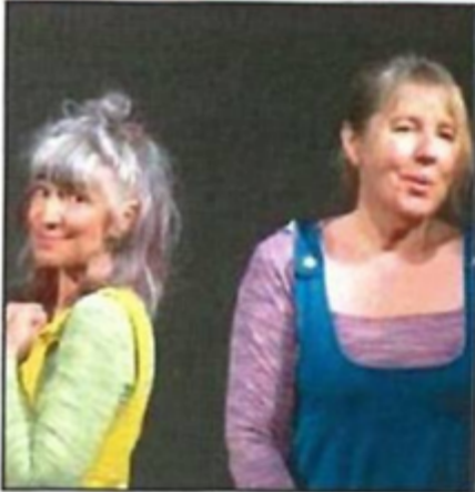
Les deux comédiennes ont passionné leur auditoire.